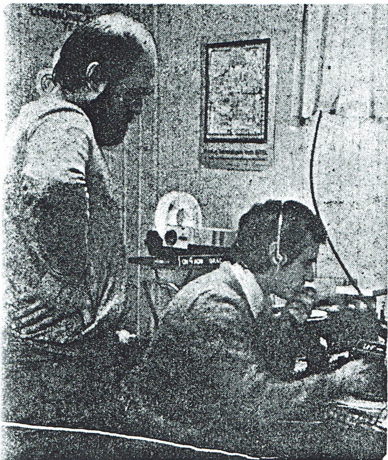
Hallo, hallo: ben ik te horen in Japan? (lg)